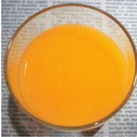
ጽዕቕ ኣራንሺ ኣይፍቀድን እዩ።

ከምቲ ቅድሚ ሕጂ ዘንበብክምዎ ንምርመራ ኣብትዳለውሉ ግዜ፣ ንጹር (ብርሃን ዘሕልፍ ሕብሪ ወይ ሕርኽርኽ ዝብል ነገር ዘይብሉ) ፈሳሲ ነገር ጥራይ ክትሰትዩ እዩ ዘለኩም። ክትበልጶምን ክትሰትይዎን ዘለኩም ነገራት ዝምልከት ሓበሬታ