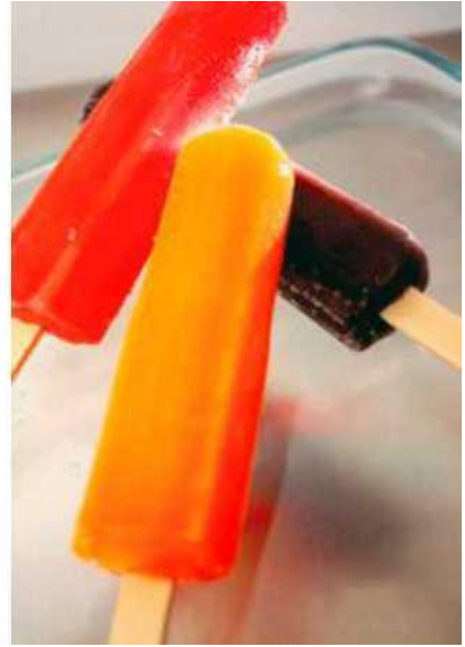
መትሓዚ ዘለዎ ናይ ፍፋታ ጀላቶ