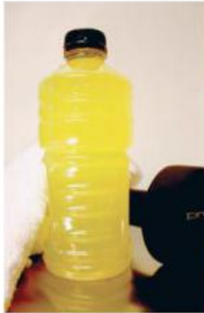
ሓይሊ ዝህብ መስተ