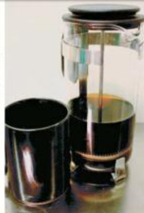
ቡን ብዘይ ጸባ