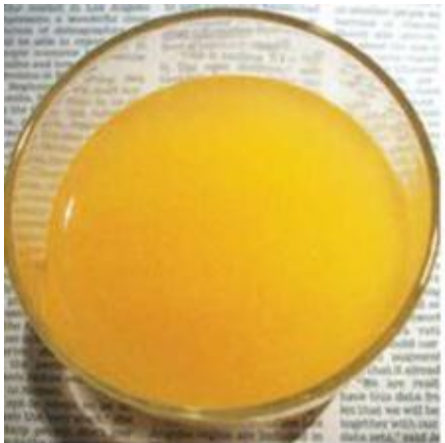
ጽዕቕ ኣናናስ ኣይፍቀድን እዩ።