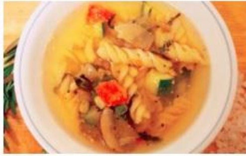
ሕብስቲ (ባኒ)፣ ምቁር ሕብስቲ፣ ፓስታ ዝብላዕ ነገር ዘለዎ መረቕ