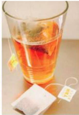
ሻሂ ብዘይ ጸባ