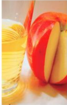
ቴፋሕ ብማይ ጋዝ