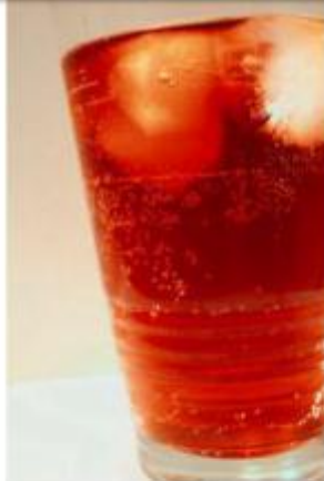
ሽኩራዊ ሶዳ (ማይ)