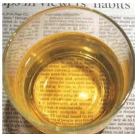
ናይ ቱፋሕ (ሜለ) ጽዕቕ ይፍቀድ እዩ።